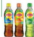
LIPTON LEMON, LIPTON PEACH, LIPTON GREEN