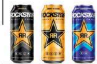
ROCKSTAR ORIGINAL, ROCKSTAR ORIGINAL ZERO, ROCKSTAR X.DURANCE