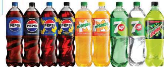
PEPSI, PEPSI ZERO CUKRU, PEPSI TWIST, PEPSI ZERO CUKRU LEMON, MIRINDA ORANGE, MIRINDA ORANGE ZERO CUKRU, 7UP, 7UP ZERO CUKRU, MOUNTAIN DEW