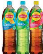
LIPTON LEMON ZERO SUGAR, LIPTON GREEN ZERO SUGAR, LIPTON RASPBERRY