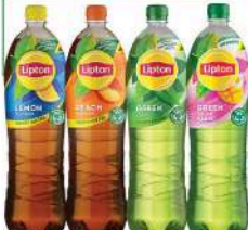
LIPTON LEMON, LIPTON PEACH, LIPTON GREEN, LIPTON GREEN MANGO FLAVOUR