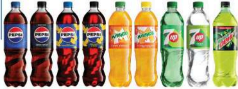
PEPSI, PEPSI ZERO CUKRU, PEPSI TWIST, PEPSI ZERO CUKRU LEMON, MIRINDA ORANGE, MIRINDA ORANGE ZERO CUKRU, 7UP, 7UP ZERO CUKRU, MOUNTAIN DEW