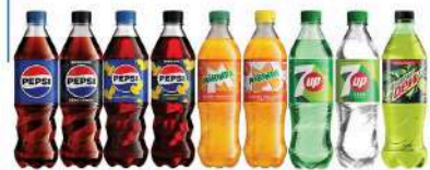
PEPSI, PEPSI ZERO CUKRU, PEPSI TWIST, PEPSI ZERO CUKRU LEMON, MIRINDA ORANGE, MIRINDA ORANGE ZERO CUKRU, 7UP, 7UP ZERO CUKRU, MOUNTAIN DEW