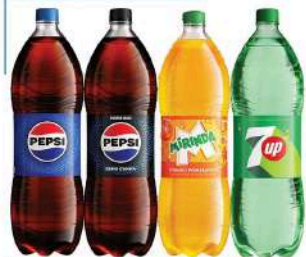
PEPSI, PEPSI ZERO CUKRU, MIRINDA, 7UP